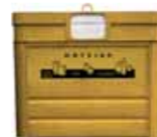
Horia, plastiko, ontzi metaliko eta tetrabrik-entzatzak.

Aurreko ikasturtean Eskolako Agenda 21-en parte hartzen duten Arratiako ikastetxeetan hondakinen gaia jorratu zuten bai eskola mailan, bai udalerrri mailan. Hartutako konpromisoen artean daude paper kontsumoa gutxitzea, hondakinen birziklapenaren aldeko apustua eta gai horren inguruan herritarrek sentsibilizatzeko. Hala ere, ikasleek hainbat ekintza proposatu zituzten hondakinen kudeaketa hobetze aldera. Eskolako Agenda 21-en barruan eginiko foroetan, Dima, Igorre eta Zeanuriko eskoletako ikasleek egindako eskaerei erantzunez, Arratiako Udalen Mankomunitateak gaikako edukiontzia ipini ditu Arratiako ikastetxeetan papera, ontziak eta beira sailkatu ahal izateko. Eskola mailan birziklapen tasa igotzeaz gain, txikiak sentsibilizatzeko da helburua, horretarako koloreen arabera edukiontzia ezberdinak ezagutaraziz: