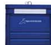
Urdina, paper eta kartoiarentzat.