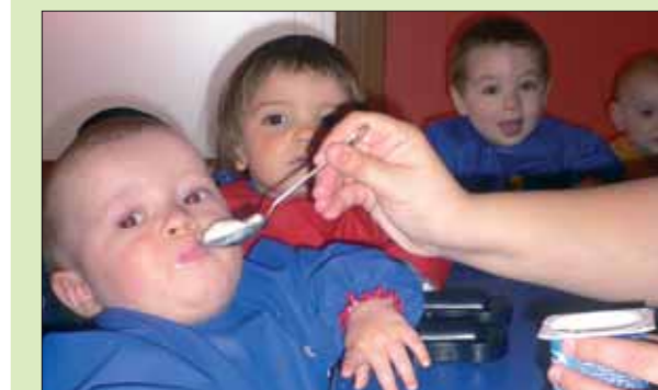
Eskola jantokietan haurren zaintzari buruzkoa da programetako bat.

Informazio gehiago nahi izanez gero, Arratiako Behargintzako bulegoetara hurbildu.