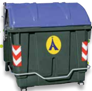
Papera/kartoaia Papel y cartón