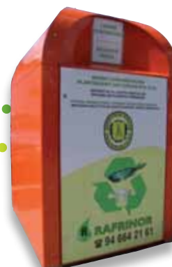
Etxean erabilitako olioia Aceite doméstico usado