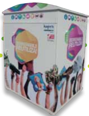
Berrerabilpenarako edukiontzia Reutilización